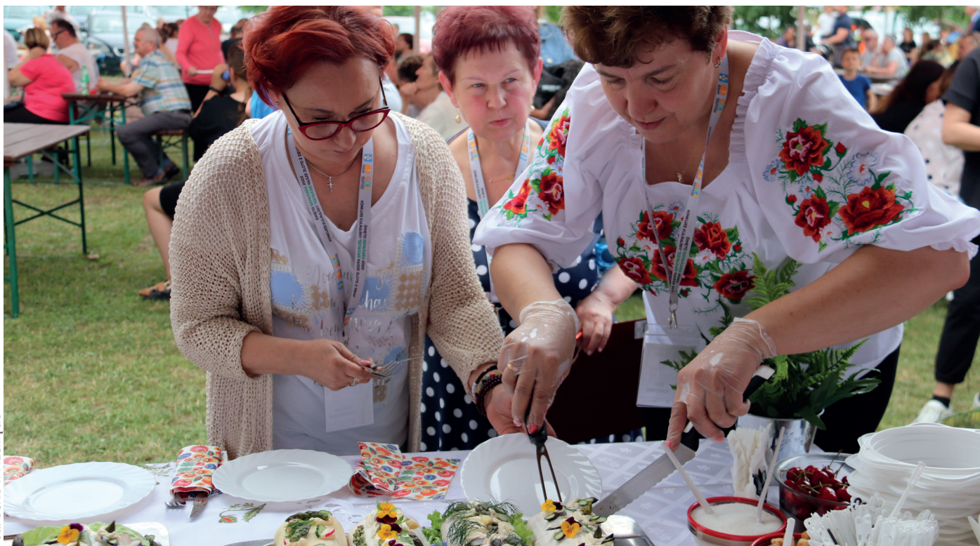
Kulinarne zmagania KGW podczas konkursu „Szparagi nasze złoto z ziemi” zorganizowanego przez Gminne Centrum Kultury i Bibliotekę w Przemęcie

ne Centrum Kultury i Biblioteka w Przemęcie przeprowadziło konkurs kulinarny „Szparagi nasze złoto z ziemi”. Operacja mająca na celu aktywizację mieszkańców wsi na rzecz podejmowania inicjatyw z zakresie rozwoju obszarów, w tym tworzenie miejsc pracy na terenach wiejskich, uzyskała dofinansowanie w wysokości 36 tys. zł.