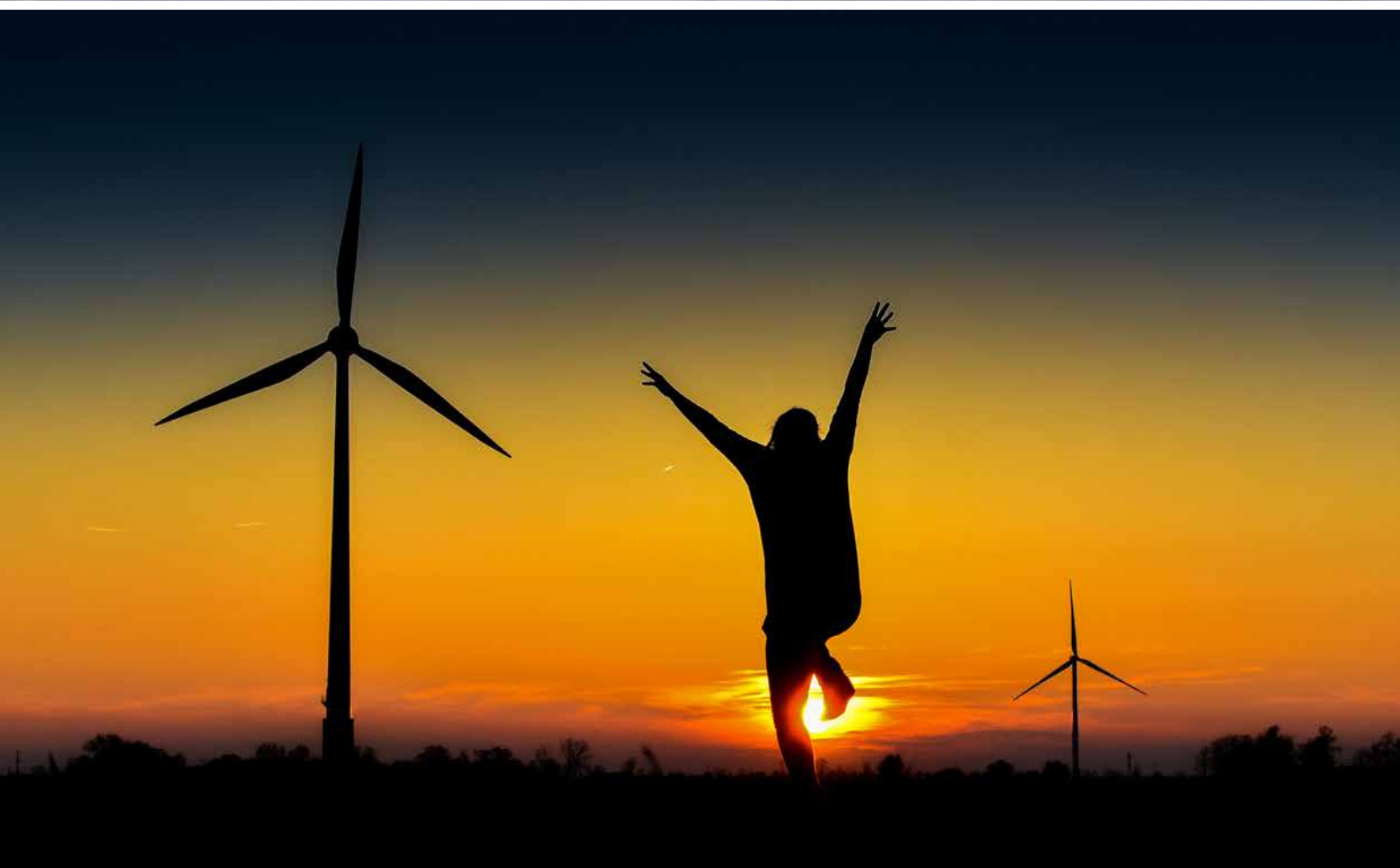
autor: Adam Andrzejewski, zdjęcie wykonane w miejscowości Wola Koszucka Parcele w gminie Słupca (powiat słupecki).