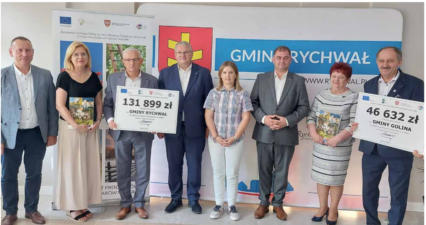
Gmina Rychwał dofinansowanie w kwocie 131 899 zł przeznaczy na modernizację trybun na stadionie miejskim w Rychwale, natomiast Gmina Golina, która otrzymała pomoc w kwocie 46 632 zł, wybuduje plac zabaw w Golinie przy ul. Kolejowej