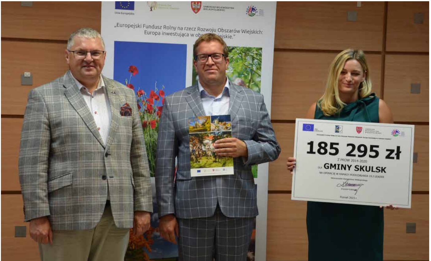
Gmina Skulsk otrzymała dofinansowanie z PROW w kwocie 185 295 złotych na budowę pomostu na jeziorze Skulskim.

Wszystkie te inwestycje zostały dofinansowane w ramach wdrażania strategii rozwoju lokalnego kierowanego przez społeczność. Przypomnijmy, że na terenie powiatu konińskiego