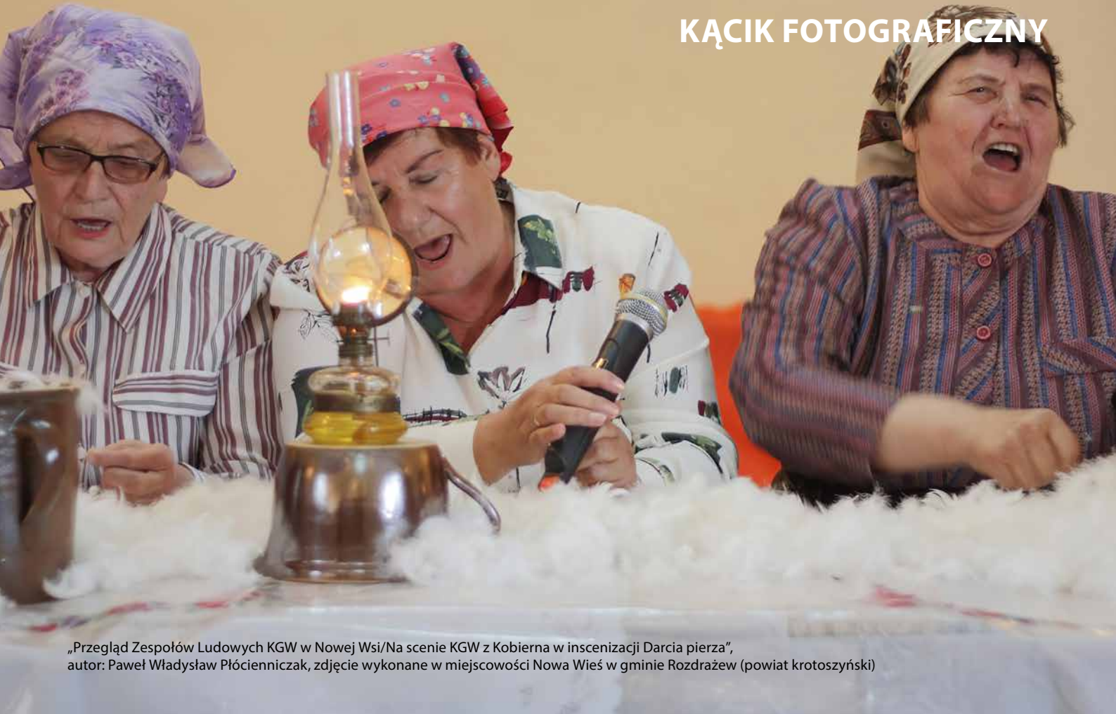
„Przeгляд Zespołów Ludowych KGW w Nowej Wsi/Na scenie KGW z Kobierna w inscenizacji Darcia pierza”, autor: Paweł Władysław Płócienniczak, zdjęcie wykonane w miejscowości Nowa Wieś w gminie Rozdrażew (powiat krotoszyński)