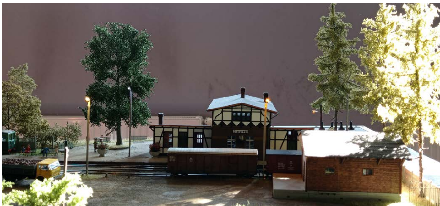
W ramach wydarzenia zorganizowanego przez Gminę i Miasto Stawiszyn odbyła się wystawa modeli kolejek wąskotorowych.