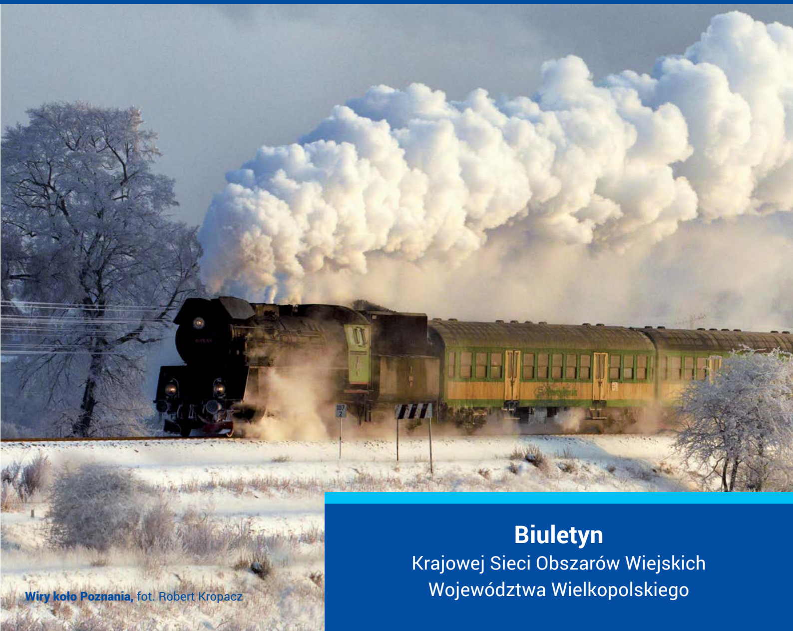
Wiry koło Poznania