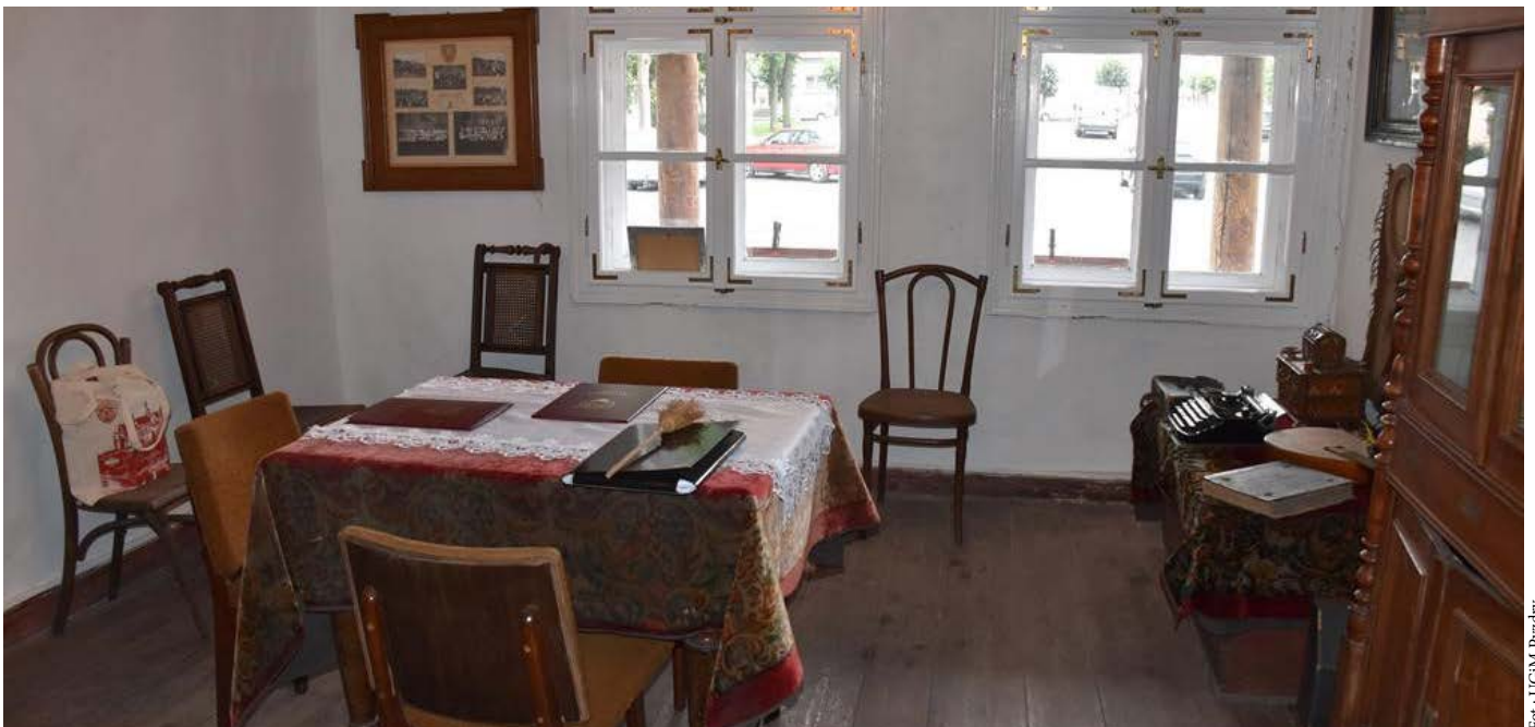
Dom podcieniowy w Pyzdrach został zakupiony z PROW 2014–2020 w ramach ochrony zabytków i budownictwa tradycyjnego. Z funduszy inicjatywy LEADER zostanie przeprowadzony remont wnętrza budynku.

Gmina, po przejęciu obiektu, wykonała część niezbędnych prac remontowych, m.in. wymieniając pokrycie dachu na gont drewniany. Remont okazał się konieczny również także we wnętrzu budynku. Na ten cel pozyskano środki z PROW 2014–2020 w ramach inicjatywy LEADER. 6 października 2020 roku wicemarszałek Krzysztof Grabowski podpisał umowę w sprawie dofinansowania z burmistrzem Pyzdr Przemysławem Dębskim.