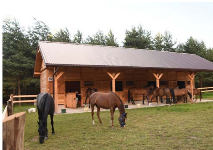
Fot.: Stowarzyszenie „Solidarni w Partnerstwie”

w gminie Tuliszków w powiecie tureckim, objętej LSR realizowaną przez Stowarzyszenie „Solidarni w Partnerstwie”. Właścicielka jest z wykształcenia zootechnikiem, ze specjalizacją hodowla koni i jeździectwo. Nie tylko konie, ale i inne zwierzęta, które tu można spotkać, nie mają dla niej