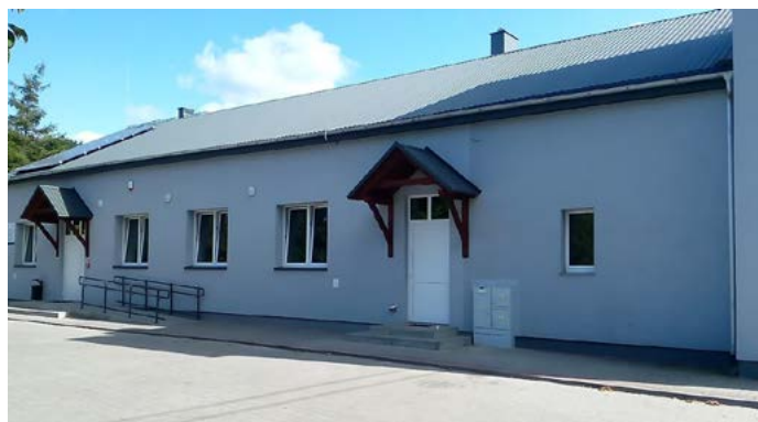
Budynek OSP Grodziec po remoncie pełni funkcję biblioteki. Inwestycja została dofinansowana z PROW 2014–2020.