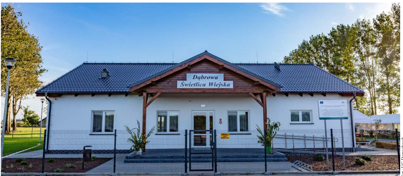
Świetlica Wiejska w miejscowości Dąbrowa w gminie Damasławek powstała dzięki dofinansowaniu z PROW 2014–2020.

W gminie Wijewo fundusze pochodzące z PROW 2014–2020 przeznaczone zostały na przebudowę wiejskich domów kultury w miejscowościach Wijewo i Zaborówiec. W budynku w Wijewie dokonano m.in. wymiany stolarki okiennej, położono drewnianą podłogę, wykonano nowe sanitariaty wraz z wyposażeniem, odremontowano