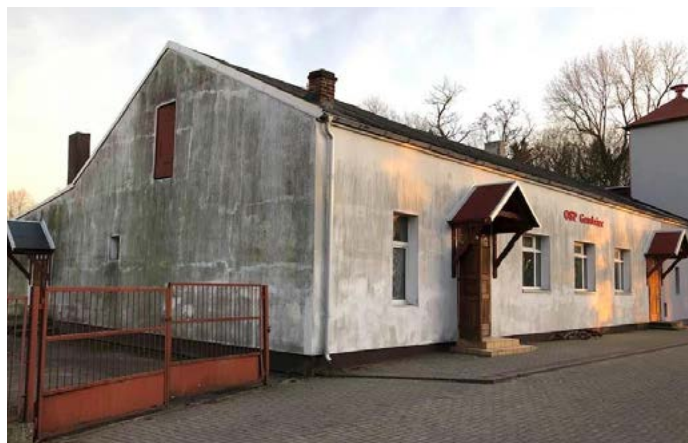
Budynek OSP Grodziec przed remontem.

Gmina Grodziec zakończyła projekt pod nazwą „Razem dla kultury – przebudowa i wyposażenie obiektów budowlanych pełniących funkcje kulturalne”. Inwestycja obejmowała trzy zadania: przebudowę wraz z wyposażeniem sali OSP