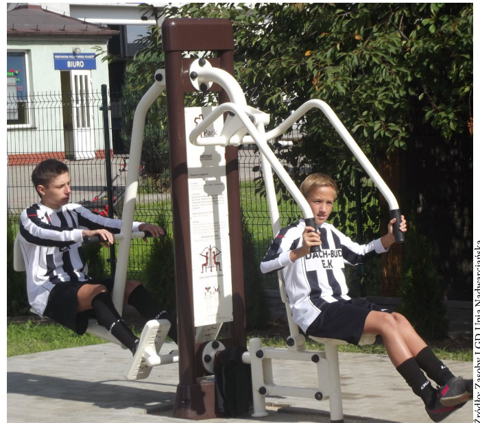
Wykonanie siłowni zewnętrznej przy budynku GOK-u dla mieszkańców Strzałkowa jako przykład kształtowania przestrzeni publicznej. Inwestycję zrealizowano dzięki środkom pochodzącym z Programu Rozwoju Obszarów Wiejskich na lata 2007–2013.

ruch turystyczny odnotowany w powiecie, na terenie którego realizowana jest inwestycja. Trzy punkty można uzyskać w sytuacji, gdy na 1000 osób zamieszkujących dany powiat przypada co najmniej 100 noclegów udzielonych turystom. Kolejne trzy punkty będą przyznawane projektom innowacyjnym co najmniej w skali województwa. Tyle samo punktów przewidziano w sytuacji, gdy operacja uwzględnia wyposażenie obiektu budowlanego w mikroinstalację zapewniającą pokrycie co najmniej w 50% zapotrzebowania tego obiektu na energię lub w sytuacji, gdy dany obiekt już taką instalację posiada.