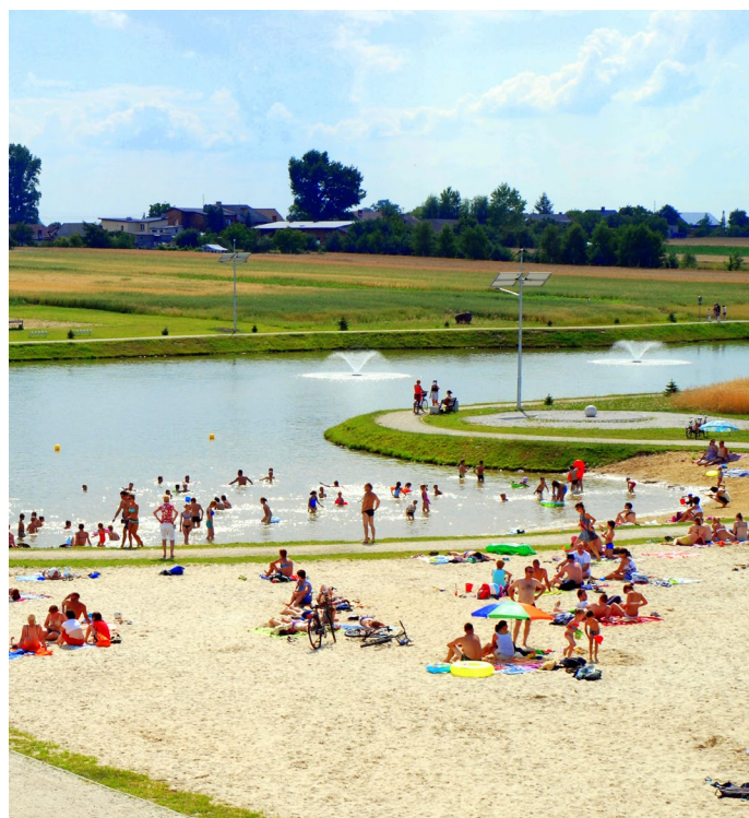
Zbiornik wodny „Kąpielka” w Raszkowie.

Na podobnym zasadach, jak w przypadku kształtowania przestrzeni publicznej, przyznawane będą punkty za kryterium uwzględniające ruch turystyczny w powiecie, na terenie którego siedzibę ma gmina lub instytucja kultury