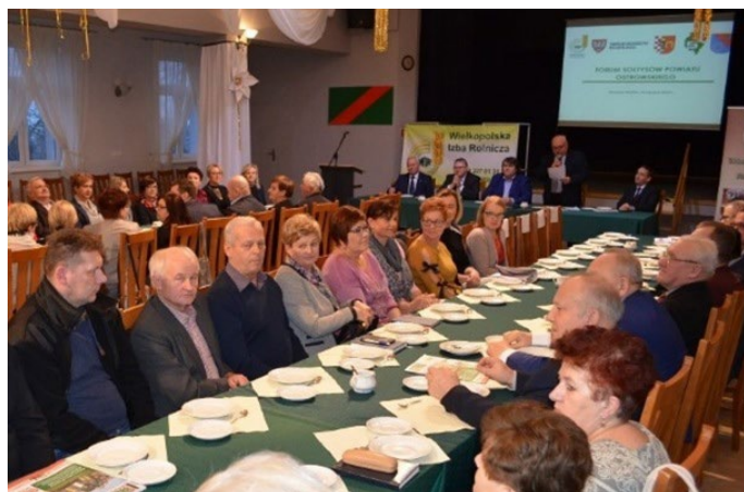
Spotkanie w Wysocku Wielkim w powiecie ostrowskim.