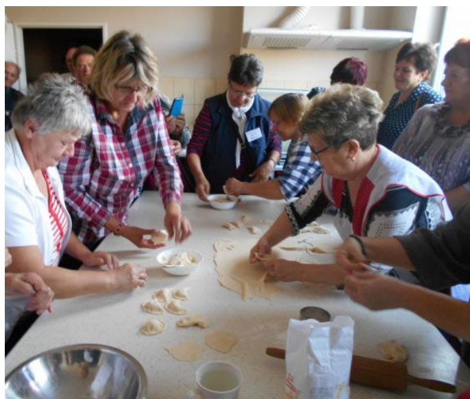
W ramach projektu współpracy Lokalna Grupa Działania KOLD zorganizowała dla gości z niemieckiej LGD Fläming-Havel warsztaty lepienia tradycyjnych polskich pierogów. Spotkanie odbyło się w Gminnym Ośrodku Kultury w Kuślinie.

Jednym ze zrealizowanych już projektów jest wspólna inicjatywa Stowarzyszenia Dolina Noteci oraz LGD Lider Zielonej Wielkopolski, pn. „Centrum Edukacji Lokalnej Przedsiębiorczości”. Operacja, dofinansowana ze środków europejskich w kwocie 114,5 tysiąca złotych, zakładała zorganizowanie w czerwcu i lipcu 2017 roku Regionalnych Targów Przedsiębiorczości i Edukacji w Chodzieży i Środzie Wielkopolskiej. Podczas imprezy miejscowym społecznościom zaprezentowali się lokalni pracodawcy. Swoją ofertę przedstawiły też placówki edukacyjne oraz ośrodki przedszkolne. Poza tym w ramach projektu powstał film dotyczący tematyki przedsiębiorczości, edukacji i promocji obszaru objętego strategiami obu lokalnych grup działania. Partnerzy operacji przeprowadzili szkolenie podnoszące kompetencje uczestników w zakresie wykorzystania social media jako narzędzia pomocnego w poszukiwaniu zatrudnienia oraz budowaniu strategii marketingowej. Zorganizowano również dwa wyjazdy studyjne dla osób zamieszkujących gminy, na terenie których funkcjonują LGD biorące udział w przedsięwzięciu.