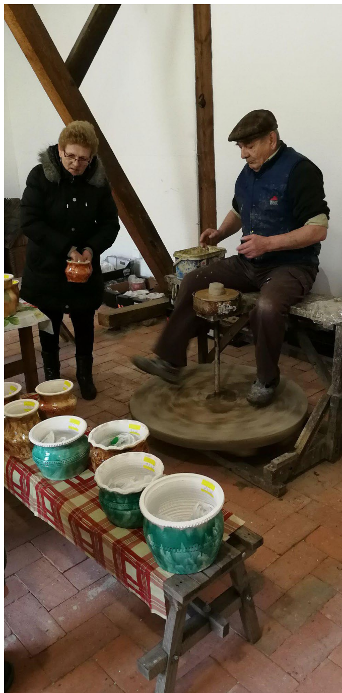
Pokaz garncarstwa zrealizowany w ramach wydarzenia „Wielkanoc na Krajinie” w miejscowości Osiek nad Notecią (gmina Wyrzysk, powiat pilski).

Tymczasem Lokalna Grupa Działania „Trakt Piastów” pozyskała środki finansowe zarówno na przygotowanie, jak i realizację międzynarodowego projektu współpracy z fińską LGD, Rieska-LEADER. W kwietniu 2017 roku, w wyniku umowy podpisanej z Województwem Wielkopolskim, Stowarzyszenie uzyskało dotację pozwalającą na zaaranżowanie zagranicznego spotkania, podczas którego opracowano koncepcję wykonania tego polsko-fińskiego projektu. Obie strony zainteresowane są przygotowaniem wydarzenia promującego aktywność społeczną i gospodarczą, w szczególności kobiet. Tak zrodził się pomysł, aby w ramach projektu zorganizować Kongres Kobiet LGD. Inicjatywa ma przyczynić się również do poznania i wypro-