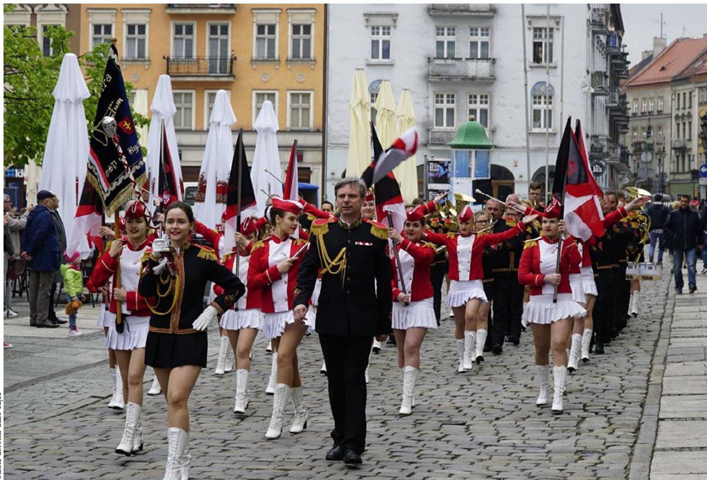
Wojewódzki Przegląd Orkiestr Dętych OSP w Kaliszu w 2017 roku. Na zdjęciu Orkiestra OSP Rychwał – zwycięzca ostatniej edycji wydarzenia.

We wspomnianym wcześniej Programie Rozwoju Ochotniczych Straży Pożarnych w Wielkopolsce na lata 2012–2020, Samorząd Województwa Wielkopolskiego zadeklarował wsparcie dla jednostek OSP w zakresie ich działalności kulturalnej. Województwo stawia na rozwój orkiestr i zespołów artystycznych poprzez udzielanie pomocy merytorycznej, w tym organizowanie szkoleń i warsztatów dla kapelmistrzów, kierowników oraz animatorów kultury, a także organizowanie przeglądów, festiwali i koncertów. Daje temu wyraz m.in. aranżując Wojewódzki Przegląd Orkiestr Dętych OSP w Kaliszu. W tym roku przegląd odbędzie się w niedzielę 23 czerwca. Będzie to już czwarta edycja tej imprezy.