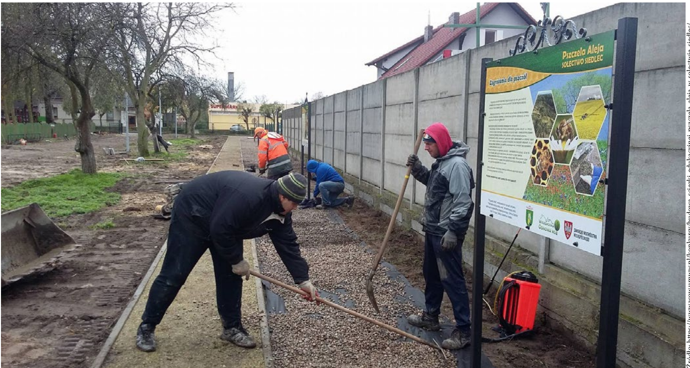
Realizacja projektu pn. „Budowa ścieżki edukacyjnej Pszczela Aleja w sołectwie Siedlec”, które zostało wyróżnione nagrodą Samorządu Województwa Wielkopolskiego podczas tegorocznej gali finałowej ogólnopolskiego konkursu „Fundusz sołecki – najlepsza inicjatywa”.