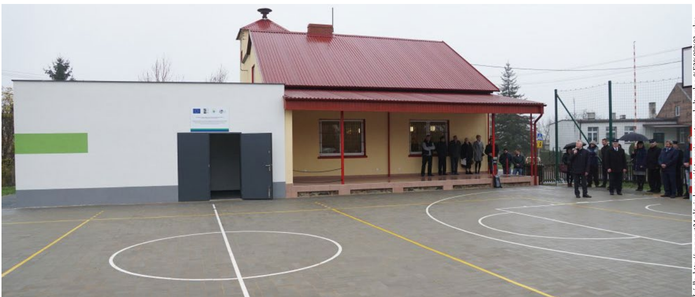
Centrum Rekreacyjno-Kulturalne w Tarnówku w gminie Połajewo powstało dzięki staraniom tamtejszej jednostki OSP, która otrzymała na ten cel środki unijne z PROW 2014–2020.