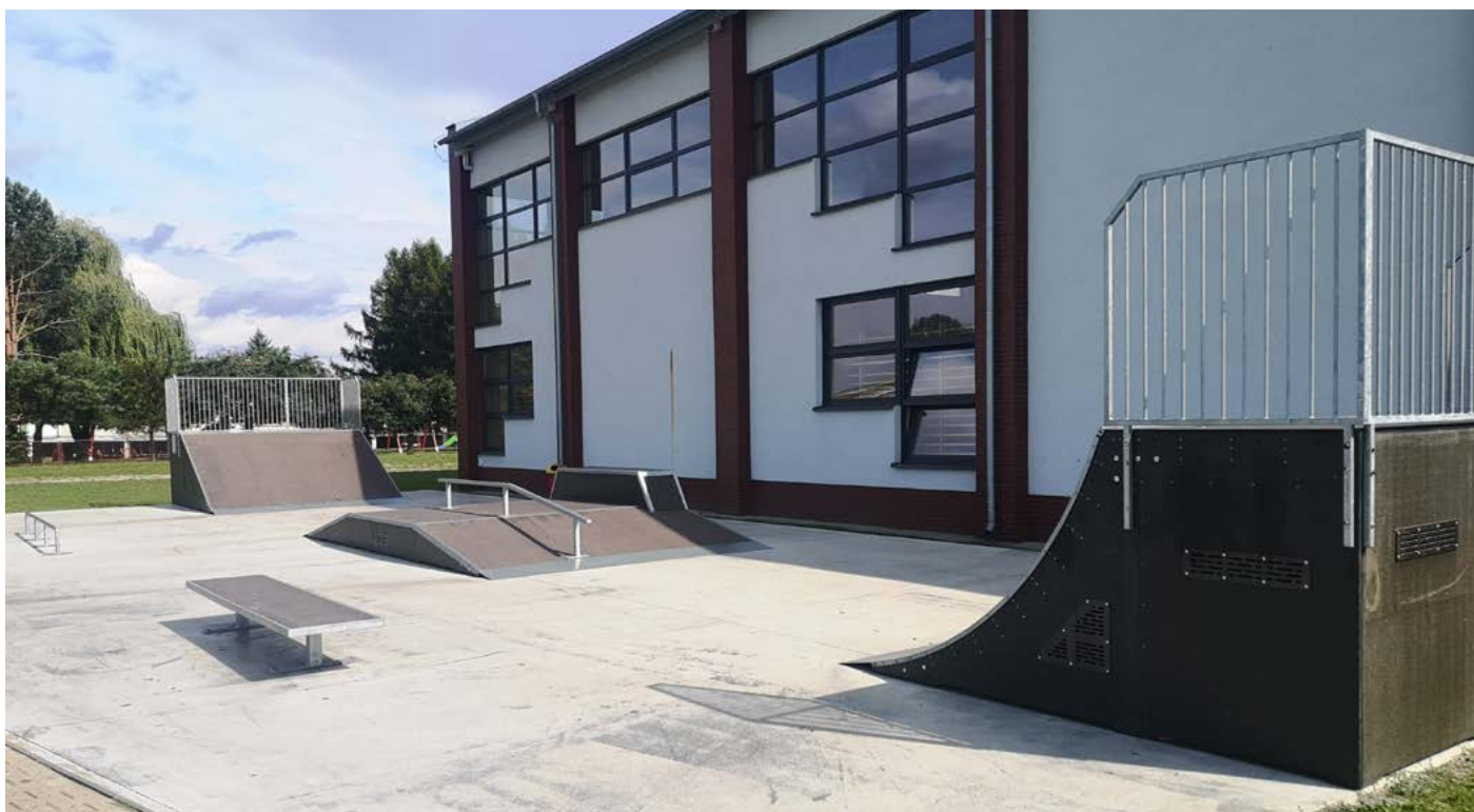
Skatepark w Rychtalu w powiecie kępińskim powstał dzięki funduszom unijnym w ramach PROW 2014–2020.

Wszystkich zainteresowanych noclegiem w obiektach agroturystycznych położonych na obszarach wiejskich województwa wielkopolskiego, odsyłamy na nowopowstałą stronę internetową www.turystyka-wlkp.pl . Znajdują się tam informacje o gospodarstwach i ośrodkach agroturystycznych nagrodzonych we wszystkich dotychczasowych edycjach konkursu na najlepszy obiekt turystyki na obszarach wiejskich w Wielkopolsce, organizowanego przez Samorząd Województwa Wielkopolskiego. W ten sposób można zaplanować np. spływ kajakowy na jednej z rzek przepływających przez nasz region lub pobyt w pełnych grzybów leśnych kompleksach – Puszczy Noteckiej i Puszczy Drawskiej. Warto też wybrać się na wędkowanie w stawach rybnych, wykąpać się w krystalicznie czystym Jeziorze Powidzkim albo postawić na wakacje w siodle. Osoby kreatywne znajdą gospodarstwa prowadzące warsztaty ceramiczne, a rodzice najmłodszych pociech obiekty, w których maluchy mogą poznać zwierzęta zagrodowe. Z kolei miłośnikom kulinariów polecamy bogatą ofertę restauracji zrzeszonych w Sieci Dziedzictwa Kulinarne Wielkopolska.