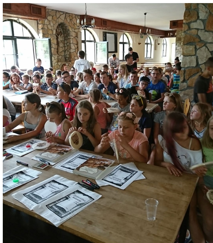
Sieć Dziedzictwa Kulinarne Wielkopolska propaguje regionalną żywność wśród najmłodszych. 26 lipca 2018 roku, w Ośrodku Pascha w Przedborowie w gminie Mikstat, dzieci robiły witraże z logiem Sieci oraz wypiekały chleb i bułki.

Uroczystościom towarzyszyła prezentacja produktów regionalnych i tradycyjnych, sygnowanych logo Sieci Dziedzictwa Kulinarne Wielkopolska. Kilkunastu członków Sieci przygotowało do degustacji swoje produkty, m.in. sery, miody i wędliny. Uczestnicy spotkania mogli również zapoznać się z rękodzielnictwem zaprezentowanym przez Lokalne Grupy Działania. Na zakończenie spotkania, na festynowej scenie wystąpił zespół Stawiszynianki oraz kabaret EWG.