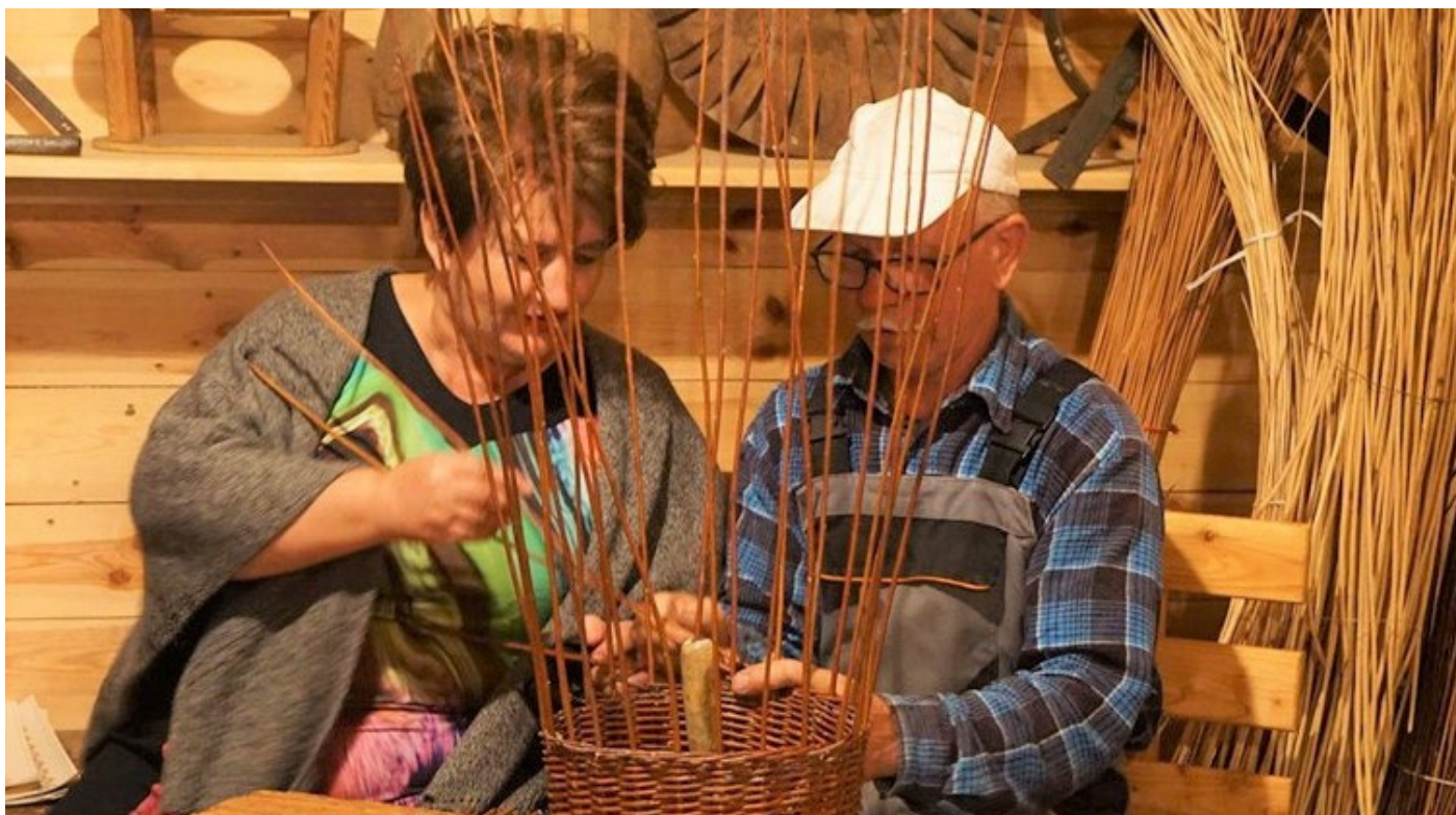
Muzeum Wikliniarstwa w Nowym Tomysłu znalazło się na szlaku wyjazdu studyjnego, zorganizowanego przez Stowarzyszenie „Między Ludźmi i Jeziorami”. Stowarzyszenie prowadzi działalność na terenie czterech gmin powiatu konińskiego: Kleczew, Kazimierz Biskupi, Skulsk oraz Wilczyn.

Efektom współpracy dwóch innych lokalnych grup działania funkcjonujących w naszym regionie jest wyjazd studyjny, który odbył się na początku czerwca 2019 roku. Na zaproszenie Wielkopolskiej Lokalnej Grupy Działania „Kraina Lasów i Jezior”, powiaty leszczyński oraz wolsztyński odwiedzili przedstawiciele Stowarzyszenia „Dolina Noteci” z Chodzieży. Poza pracownikami LGD, w wyjeździe wzięli udział członkowie dwóch chodzieskich stowarzyszeń: Stowarzyszenia Osób po Endoprotezoplastyce Biodra „Bioderko” oraz Stowarzyszenia „Młodość i Doświadczenie”.