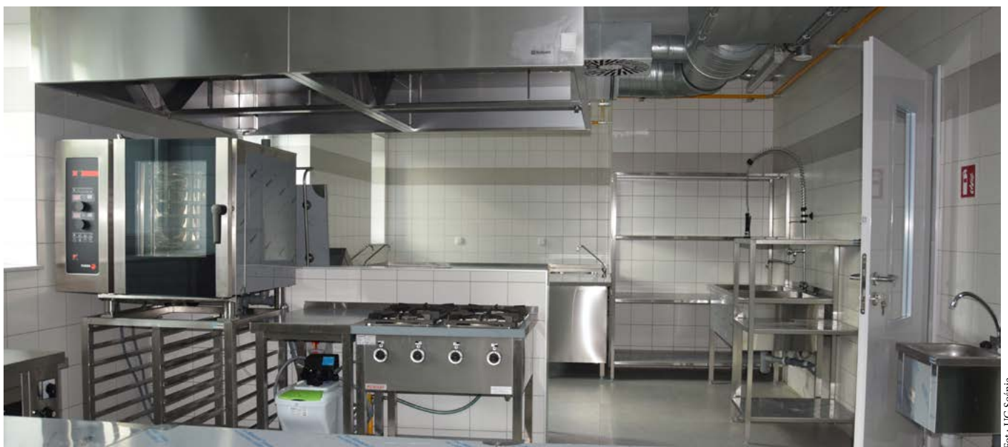
Wnętrze przebudowanej i rozbudowanej świetlicy wiejskiej w Granowcu w gminie Sośnie w powiecie ostrowskim. Projekt został dofinansowany z PROW 2014–2020 na kwotę 500 tysięcy złotych.

W lipcu 2020 roku wicemarszałek Krzysztof Grabowski podpisał umowy z przedstawicielami wielkopolskich gmin w sprawie dofinansowania tych zadań. 23 lipca 2020 roku rozstrzygnięto z kolei kolejny konkurs, organizowany w ramach tego samego programu, zatytułowany „Nasza wieś naszą wspólną sprawą”. W tym przypadku do podziału była pula 350 tysięcy złotych, a o środki mogły starać się organizacje pozarządowe. Wsparcie przyznane zostało na realizację 39 zadań publicznych. Do programu Wielkopolska Odnowa Wsi przystąpiło już 2158 sołectw z terenu 190 gmin. Rokrocznie, w ramach programu, organizowane są również konkursy „Odnowa wsi szansą dla aktywnych sołectw” oraz „Aktywna wieś wielkopolska”.