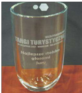
Nagroda za najlepsze stoisko targowe.

Stoisko Wielkopolski powstało dzięki współfinansowaniu z Unii Europejskiej w ramach Krajowej Sieci Obszarów Wiejskich PROW 2014-2020.