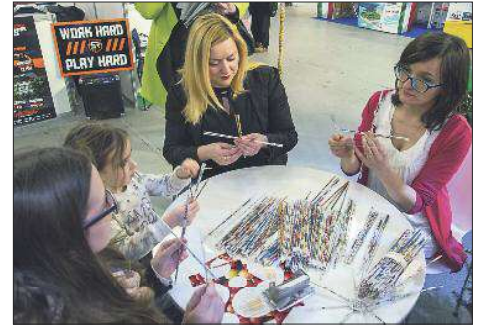
W naszym stoisku nie zabrakło również atrakcji dla najmłodszych zwiedzających. Na przykład 26 lutego odbywały się warsztaty wyplatania koszyków z wikliny papierowej.

Targi odbyły się w ostatni weekend lutego we wrocławskiej Hali Stulecia. Wzięło w nich udział ponad stu wystawców z kraju i ze świata. Wśród wielu ofert turystycznych nie mogło zabraknąć propozycji spędzenia wolnego czasu w Wielkopolsce. Samorząd województwa, wspólnie z Wielkopolską Organizacją Turystyczną oraz Stowarzyszeniem Ostrzeszowska Lokalna Grupa Działania, przygotował ekspozycję, która – jak się później okazało – zyskała największe uznanie jury konkursu na najlepsze stoisko targowe.