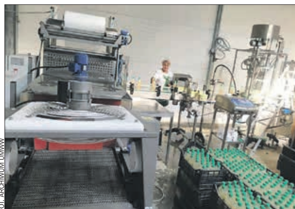
Nowa linia technologiczna w firmie STAN w Czajkowie pozwala na butelkowanie soków z kiszzonej kapusty i kiszonych ogórków, czyli produktów ubocznych kiszenia warzyw. Wpływa to na racjonalizację wykorzystania surowca. Inwestycja została zrealizowana dzięki dofinansowaniu ze środków LEADERA w ramach Programu Rozwoju Obszarów Wiejskich na lata 2014-2020.

Dzięki pomocy finansowej z Programu Rozwoju Obszarów Wiejskich na lata 2014-2020 mieszkańcy obszarów wiejskich naszego regionu podejmują działalność gospodarczą. Swoją firmę otworzyło 383 przedsiębiorców, którzy otrzymali łącznie 24,2 miliona złotych. Fundusze kierowane są również do firm, które chcą